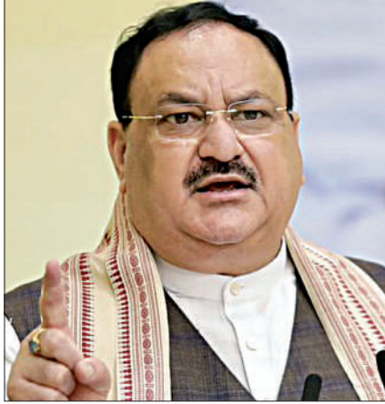
इस तरह पार्टी एक रैली के जरिए एक से दो लाख लोगों तक अपनी बात पहुंचा सकेगी। भाजपा के राष्ट्रीय अध्यक्ष जेपी नड्डा ने विभिन्न

उप्र की 403 विधानसभा सीटों के लिए 10 फरवरी से 7 मार्च तक सातों चरणों में मतदान होगा। वहीं मणिपुर की 60 सदस्यीय विस के लिए 27 फरवरी व 3 मार्च को वोटिंग होगी। पंजाब की सभी 117 सीटों के लिए 20 फरवरी को एक चरण में मतदान होगा। पहले वहां 14 फरवरी को मतदान होना था, लेकिन रविदास जयंती के कारण इसे बढ़ाकर 20 फरवरी किया गया है। उत्तराखंड की सभी 70 व गोवा की सभी 40 सीटों पर एक ही चरण में 14 फरवरी को मतदान होगा। पांचों राज्यों में मतगणना 10 मार्च को एक साथ होगी।