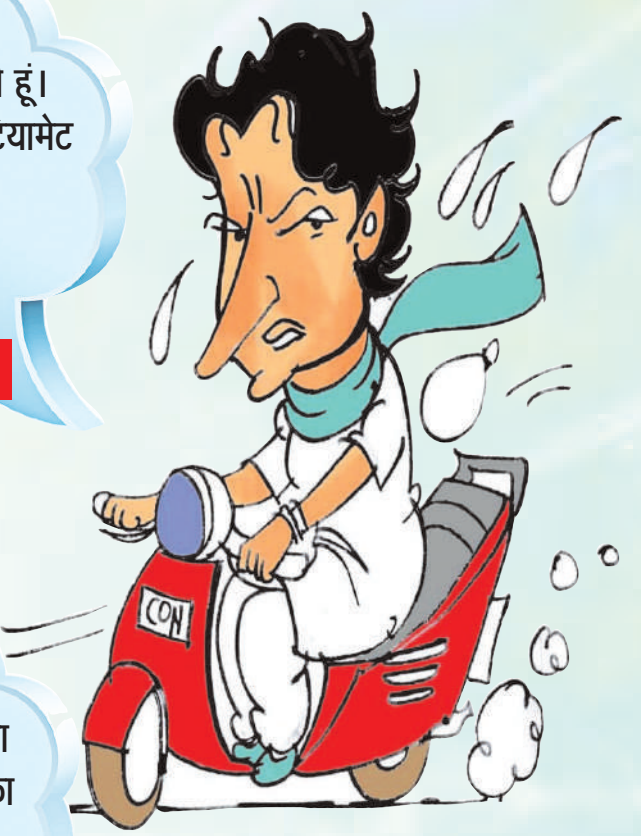
प्रियंका गांधी वाड़ा

“ झाड़ू से पंजाब में सबको दिया बुहार। हरियाणा पर दृष्टि अब लगी हमारी यार। बाद की फिर सोचेंगे । बड़े सपने देखेंगे ॥ ”