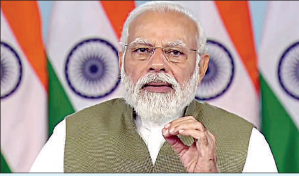
4पीएम न्यूज नेटवर्क

» सबका साथ, सबका विकास के मंत्र से मिल रहा सबका विश्वास, विपक्ष पर भी साधा निशाना