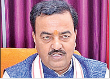
4पीएम न्यूज नेटवर्क

» सम्राट अशोक की जयंती में शामिल होने पटना गए थे डिप्टी सीएम