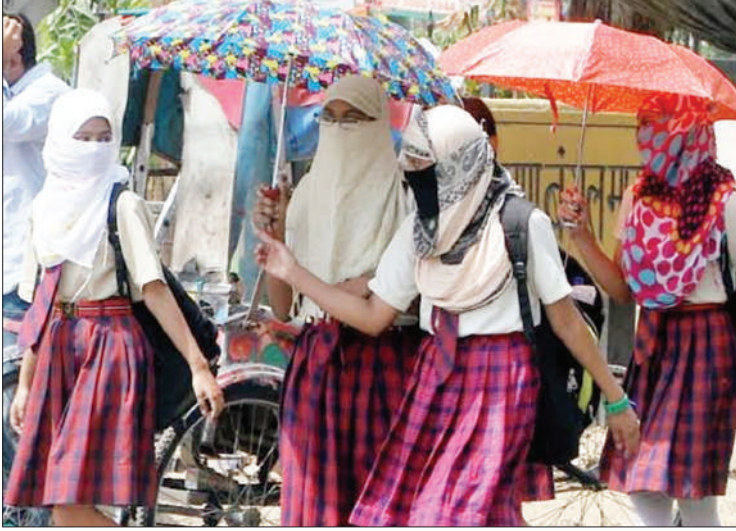
विभाग ने लू का अलर्ट जारी किया है। यूपी के कई प्रमुख शहरों में अधिकतम

मौसम विभाग के पूर्वानुमान केंद्र के मुताबिक अगले चार दिनों में तापमान 44 डिग्री के आसपास रह सकता है। लू के थपेड़े जारी रहेंगे। 12 अप्रैल तक मौसम