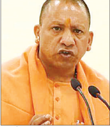
यह बड़ी उपलब्धि है।

सरकार ने तैयार की नयी कार्य संस्कृति, यूपी को बनाया दंगामुक्त अक्षय तृतीया और ईद पर करायी जाए साफ-सफाई रखे अतिरिक्त सतर्कता