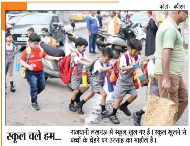
स्कूल चले हम... राजधानी लखनऊ में स्कूल खुल गए हैं। स्कूल खुलने से बच्चों के चेहरे पर उत्साह का माहौल है।

विधानसभा में प्रवेश करने या उनकी अयोग्यता का फैसला होने तक कार्यवाही में भाग लेने से रोकने की मांग की गई है।