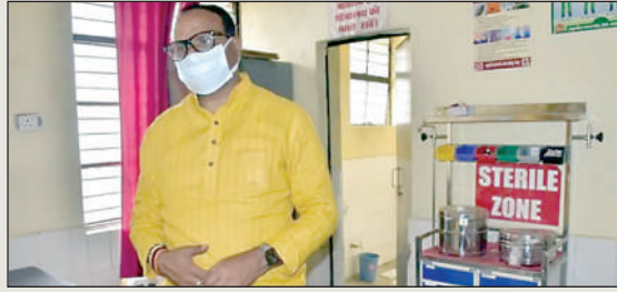
30 बेड का वार्ड समेत पूरे अस्पताल परिसर का निरीक्षण किया। अस्पताल में सुविधाओं, व्यवस्थाओं और समस्याओं को लेकर अधीक्षक डा. मनोज सिंघ से जानकारी ली। डिट्टी सीएम ने बताया कि विद्युत आपूर्ति

जौनपुर। उप मुख्यमंत्री व स्वास्थ्य मंत्री बृजेश पाठक गुरुवार को अचानक जौनपुर के जलालपुर स्थित सामुदायिक स्वास्थ्य केंद्र (सीएचसी) रैहटी पहुंच गए। सीएचसी परिसर में गंदगी देखकर डिट्टी सीएम ने अधिकारियों को फटकार लगाई। इसके साथ ही उन्होंने उपस्थिति रजिस्टर चेक किया और चिकित्सा संबंधी व्यवस्थाओं का हाल जाना। बिना किसी पूर्व सूचना के जब डिट्टी सीएम बृजेश पाठक जब शाम चार बजे के करीब सीएचसी पहुंचे तो स्वास्थ्य विभाग में खलबली मच गई। उन्होंने अस्पताल में औचक निरीक्षण का कार्यक्रम अपने फेसबुक पेज से लाइव कर दिया जिससे स्वास्थ्य कर्मियों में हड़कंप मच गया। डिट्टी सीएम ने इमरजेंसी वार्ड, प्रसव कक्ष,