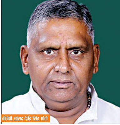
बीजेपी सांसद देवेन्द्र सिंह भोले

जिले के अफसर दो गुटों में बंटे नजर आ रहे हैं, जिसका असर क्षेत्र के विकास पर पड़ रहा है और इसका खामियाजा कानपुर देहात की भोली भाली जनता को भुगतना पड़ रहा है। कानपुर देहात से बीजेपी के सांसद हैं देवेन्द्र सिंह भोले और कानपुर देहात से ही