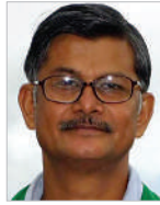
पूर्व विधायक एवं अग्रज किसान संघर्ष समिति

आप सबने 5जी स्पेक्ट्रम की भारत सरकार द्वारा बोलियां लगाए जाने के बारे में सुना होगा अर्थात आजकल सरकारें पानी पर तो कब्जा कर ही चुकी है अब हवा की तरंगों की भी बिक्री कर रही है। आपने पहली बार इस तरह की बिक्री के बारे में 2011 में सुना होगा। तब तत्कालीन दूरसंचार मंत्री ए राजा और कनिमोडी को जेल भेजा गया था लेकिन 2017 में सीबीआई कोर्ट ने सब को बरी कर दिया। तब आरोप लगा था कि 1.76 लाख करोड़ का घोटाला हुआ है। इस बार 5जी स्पेक्ट्रम की नीलामी को लेकर कोई चर्चा नहीं है। जब भी कोई बोली लगाई जाती है तब एक निश्चित राशि तय की जाती है। यह राशि साढ़े चार लाख करोड़ की थी लेकिन बिक्री डेढ़ लाख करोड़ में की गई। दूरसंचार मंत्री ने कहा कि 71 प्रतिशत 5जी स्पेक्ट्रम बेच दिया गया जिससे देश लाभान्वित हो सकेगा। इस बोली से यह स्पष्ट हो गया कि अंबानी ने अपना एकाधिकार दूरसंचार क्षेत्र में कायम रखा है। एयरटेल ने 45,084 करोड़, वोडाफोन ने 18,799 करोड़, जियो ने 88,078 करोड़ और अडानी ने 212 करोड़ की खरीद की है।