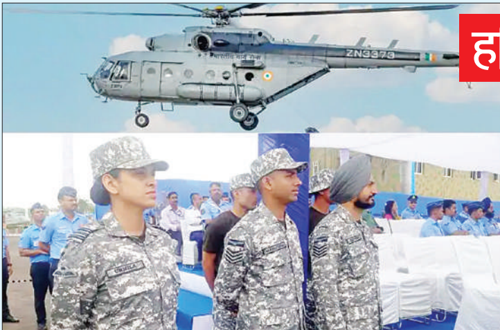
समाचार एजेंसी एनआई ने इसकी तस्वीर जारी की है, जिसमें इंडियन

नई दिल्ली। भारतीय वायुसेना की 90वीं वर्षगांठ के मौके पर चंडीगढ़ स्थित वायुसेना स्टेशन (सुखना लेक) में पूरी दुनिया को भारत की आसमानी ताकत का एहसास कराया गया। इस खास मौके पर इंडियन एयरफोर्स के जवानों के लिए एक नई लड़ाकू वर्दी भी लॉन्च की गई है। नयी हथियार प्रणाली शाखा के गठन का भी ऐलान किया गया। वायुसेना प्रमुख वी आर चौधरी ने कहा कि हम कर्मियों के लिए नए पैटर्न की लड़ाकू वर्दी पेश कर रहे हैं।