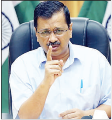
के मुद्दे पर लड़ा जाएगा। साथ ही वादा किया कि चुनाव जीतने पर आप पांच वर्ष में दिल्ली को स्वच्छ

नई दिल्ली। दिल्ली नगर निगम (एमसीडी) चुनाव की घोषणा से पहले ही दिल्ली की सियासत गरमा गई है। सतारूढ़ भाजपा को घेरने के लिए गाजीपुर लैंडफिल साइट पहुंचे मुख्यमंत्री अरविंद केजरीवाल ने कहा कि एमसीडी का चुनाव कचरे