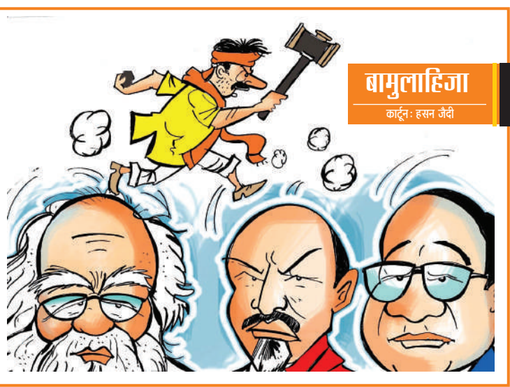
बामुलाहिजा कार्टून: हसन जेदी