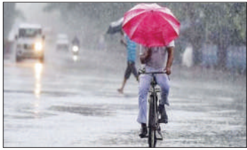
12 साल में अप्रैल में अधिकतम तापमान इतना कम

देश में वार्षिक वर्षाजल का 70 फीसदी मानसून के दौरान गिरता है। इससे देश की 60 फीसदी कृषि भूमि की सिंचाई होती है। देश की आधी आबादी सीधे तौर पर मानसूनी बारिश से जुड़ी खेती पर आश्रित है। मौसम विभाग के मुताबिक, भारत में मानसून को मजबूती देने वाली ला नीना की स्थिति अब कमजोर पड़ रही है। अप्रैल से जून तक सामान्य स्थिति बनी रहेगी, इसके बाद अल नीनो की स्थिति बनना शुरू हो जाएगी, जिससे भारत में मानसून कमजोर होगा।