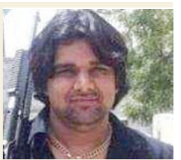
दो सहायक अधीक्षक, एक हेड वार्डर व चार वार्डर की लापरवाही सामने आई

नई दिल्ली। टिल्लू ताजपुरिया हत्याकांड में जेल प्रशासन ने लापरवाही बरतने के आरोप में आठ जेलकर्मीयों को निलंबित कर दिया है, जबकि तमिलनाडु पुलिस के नौ जवानों के खिलाफ कार्रवाई करने के लिए वहां के कमांडेंट को पत्र लिखा है। इसके अलावा इन सभी नौ पुलिस कर्मियों के खिलाफ विभागीय कार्रवाई के तहत आरोपपत्र दाखिल कर दिया गया है। जेल अधिकारी ने बताया कि विभागीय जांच में दोषी पाए जाने के बाद इनके खिलाफ प्राथमिकी दर्ज कराई जा सकती है।