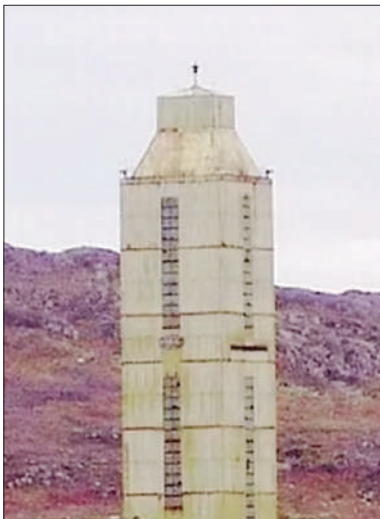
गड्ढे की खुदाई धरती के इतने नीचे के रहस्य को जानने के लिए करवाई है। इस गड्ढे की खुदाई आज से नहीं चल रही थी। सत्तर के दशक में ही इसकी शुरुआत हो गई थी। दो दशक के बाद इस छेद को 12 हजार दो सौ

स्वर्ग और नर्क का कांसेप्ट आपने जरूर सुना होगा। कुछ लोगों का कहना है कि जब इंसान के कर्म अच्छे होते हैं तो वो मौत के बाद स्वर्ग जाता है। वहां उसके स्वागत में अप्सराएं होती हैं। अच्छा खाना और अच्छी जिंदगी के साथ इंसान स्वर्ग में ऐश करता है। लेकिन अगर इंसान ने बुरे कर्म किये हैं, तो उसकी लाइफ खत्म होने के बाद नर्क में एंट्री होती है। नर्क में जलती आग में इंसान की आत्मा को झोंक दिया जाता है। हालांकि, किसी जीवित ने आजतक स्वर्ग या नर्क को देखा नहीं है।