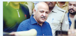
एवेन्यू कोर्ट में इस मामले की अगली सुनवाई 31 जुलाई को सुबह 10:30 बजे होगी। आबकारी नीति से

दिल्ली आबकारी नीति मामले में गिरफ्तार दिल्ली के पूर्व डिप्टी सीएम मनीष सिसोदिया को कोर्ट में पेश किया गया। इस मामले में कोर्ट ने सीबीआई से पूछा है कि क्या सभी आरोपियों को चार्जशीट से जुड़े दस्तावेज दे दिए गए हैं? इस पर सीबीआई ने कोर्ट को बताया कि सभी आरोपियों को चार्जशीट से जुड़े दस्तावेज दे दिए गए हैं। राज्य