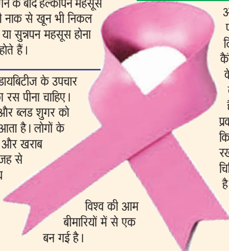
विश्व की आम बीमारियों में से एक बन गई है।

अनार का जूस कैंसर पीड़ित लोगों के लिए फायदेमंद है। प्रोस्टेट कैंसर सेल्स को रोकने के लिए अनार के जूस का सेवन करना चाहिए। ये कैंसर के जोखिम को भी कम कर सकता है। कैंसर के मुख्य लक्षण इस बात पर निर्भर करते हैं कि व्यक्ति ने किस प्रकार का कैंसर विकसित किया है। हालांकि, कुछ सामान्य संकेत हैं जो विभिन्न प्रकार के कैंसर के बीच ओवरलैप करते हैं। ऐसे में किसी भी नए या चिंताजनक लक्षणों का ध्यान रखना और सुरक्षित रहने के लिए अपने चिकित्सक से परामर्श करना महत्वपूर्ण है। कैंसर के लक्षणों पर ध्यान देने के लिए आंत्र की आदतों में बदलाव, सूजन, सांस फूलना, गांठ और नए तिल का बनना शामिल हैं।