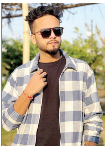
के सेक्टर 49 थाने में एल्विश समेत 5 के खिलाफ केस दर्ज किया गया है।

हालांकि एल्विश ने कहा कि मेरे ऊपर लेग आरोप बेबुनियाद हैं। पुलिस द्वारा दर्ज की गई एफआईआर में मुख्य अभियुक्त बिग बास ओटीटी 2 विजेता एलवीश यादव हैं। एलवीश यादव पर आरोप है कि वे नोएडा और एनसीआर में सांपों की बाइट वाली हाई प्रोफाइल पार्टियां ऑर्गनाइज कर रहे थे, नोएडा