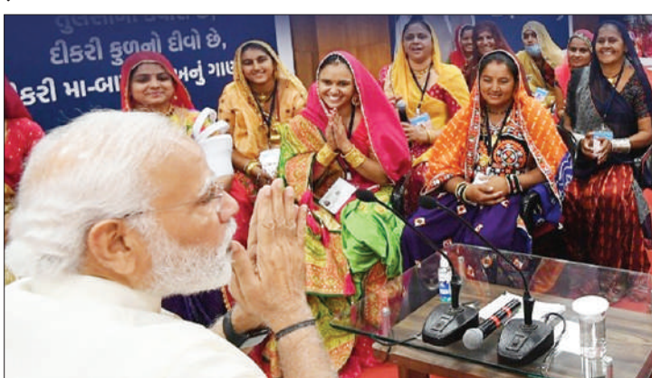
खाद्य पदार्थ के निर्यात में 150प्रतिशत की वृद्धि की है। मोदी ने कहा, आज हमारा कृषि-निर्यात विश्व स्तर पर 7वें स्थान पर पहुंच गया है, खाद्य क्षेत्र में, ऐसा कोई क्षेत्र नहीं है जिसमें भारत ने प्रगति न की हो, यह विकास तीव्र

वर्ल्ड फूड इंडिया के उद्घाटन कार्यक्रम में पीएम मोदी ने कहा, स्वाद और तकनीक का ये फ्यूजन एक नए भविष्य को जन्म देगा, एक नई इकोनॉमी को गति प्रदान करेगा। आज की बदलती हुई दुनिया में 21वीं सदी की सबसे प्रमुख चुनौतियों में से एक फूड सिक्योरिटी भी है, इसलिए वर्ल्ड फूड इंडिया का ये आयोजन और भी अहम हो गया है। पिछले नौ वर्षों में प्रसंस्कृत