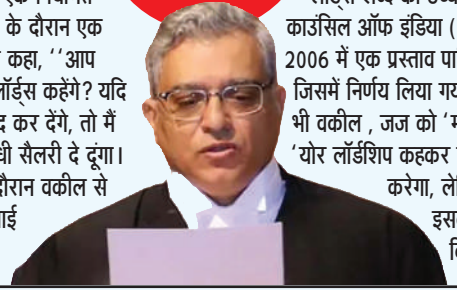
बात करने पर कड़ी आपत्ति जताई। दरअसल, सीजेआई डी वाई चंद्रचूड़, जस्टिस जेबी पारदीवाला और जस्टिस मनोज मिश्रा की पीठ एक मामले की सुनवाई कर रही थी।

सुप्रीम कोर्ट के जज बोले: केवल सर से करें संबोधन