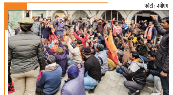
धरना अपनी मांगों को लेकर यूपी ग्रामीण स्वच्छताग्राही कर्मचारी संघ ने भाजपा प्रदेश कार्यालय के बाहर प्रदर्शन किया।