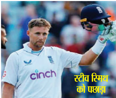
स्टीव स्मिथ को पछड़ा

दरअसल, इंग्लैंड की शुरुआत बेहद खराब रही। पहले सेशन तक टीम ने अपने पांच विकेट गंवा दिए थे। जिसके बाद रूट ने बेन फॉक्स के साथ मिलकर टीम को मुश्किल समय से उबारने का काम किया