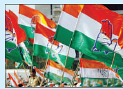
कि सीईसी की बैठक में करीब 100 लोकसभा सीटों के लिए उम्मीदवारों के नामों पर विचार होगा और प्रत्याशियों

कांग्रेस पार्टी महासचिव जयराम रमेश ने कहा कि सीईसी की बैठक सात मार्च को शाम छह बजे होगी। सीईसी की बैठक में विभिन्न स्कीमिंग कमेटी द्वारा भेजे नामों में से उम्मीदवारों के नामों पर मुहर लगाई जाती है। राजस्थान, छत्तीसगढ़ और कुछ अन्य राज्यों के लिए स्कीमिंग कमेटी की बैठक हो चुकी है। सूत्रों का कहना है