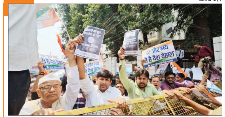
आक्रोश राजनीतिक दलों के आयकर से छूट के बावजूद कांग्रेस को भेजे गए नोटिस के विरोध में कांग्रेस कार्यकर्ताओं ने किया प्रदर्शन।