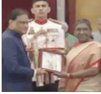
राष्ट्रपति लाल कृष्ण आडवाणी को छोड़कर अन्य चार विभूतियों को मरणोपरांत भारत

2020 से 2023 तक किसी को भी भारत रत्न नहीं दिया गया था, लेकिन 2024 के लिए केंद्र सरकार ने इन पांच विभूतियों को चुना। राष्ट्रपति भवन में आयोजित इस समारोह में केवल उप