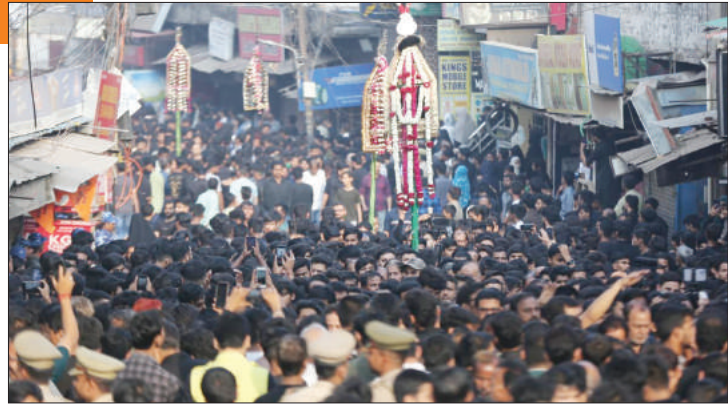
जुलूस सहदातगंज स्थित मस्जिद ए कूफा से 19वीं रमजान को निकाला गया ग्लोम के ताबूत (कॉबल का ताबूत) का जुलूस।