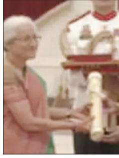
रत्न सम्मान दिया गया। पूर्व पीएम नरसिंह राव को भारत रत्न से सम्मानित करने के