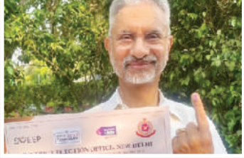
विदेश मंत्री एस. जयशंकर