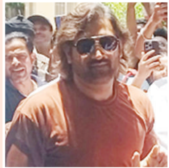
क्रिकेटर महेन्द्र सिंह धोनी