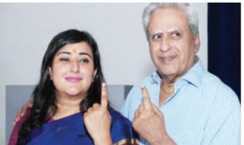
अपने पिताजी के साथ बांसुरी स्वराज।