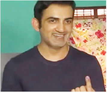
भाजपा सांसद गौतम गंभीर