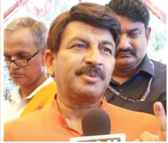
सांसद मनोज तिवारी