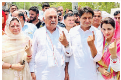
पूर्व मुख्यमंत्री भूपेन्द्र हुड्डा परिवार के साथ।