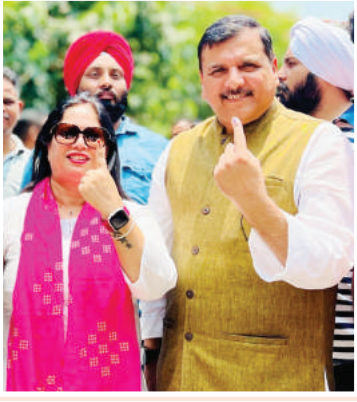
आप सांसद संजय सिंह सपत्नीक