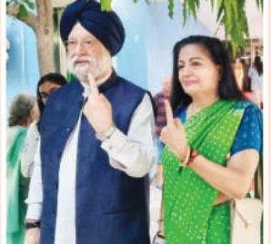
केंद्रीय मंत्री हरदीप पुरी पत्नी के साथ।