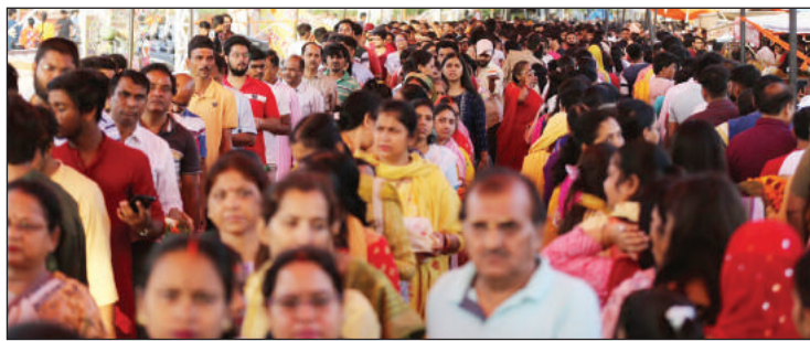
भक्तों ने डेरा डालना शुरू कर दिया था। रात 12 बजे दंडवत करते भक्तों ने महावीर