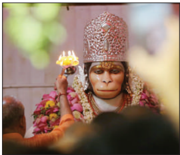
तो दोपहर तीन बजे से ही खुल गया। झूले लगने शुरू हो गए थे। मंदिर परिसर में

लखनऊ। बजरंग बली को समर्पित ज्येष्ठ माह का पहला बड़ा मंगल आज है। राम भक्त हनुमान के मंदिर रंग-बिरंगी रोशनी से जगमगा रहे हैं। खासकर लखनऊ में इसका विशेष महत्व है और यह भव्य पर्व के रूप में मनाया भी जाता है। सोमवार रात 12 बजे से ही दर्शन पूजन का सिलसिला शुरू हो गया। हनुमान सेतु मंदिर में रात 12 बजे बजरंग बली की आरती हुई और बड़ी संख्या में भक्तों ने अपने आराध्य देव के दर्शन किए। वहीं अलीगंज का नया हनुमान मंदिर