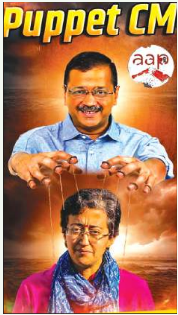
4पीएम न्यूज नेटवर्क

नई दिल्ली। आतिशी मार्लेना सिंह को दिल्ली की नई मुख्यमंत्री चुन लिया गया है। जिसके बाद आतिशी के मुख्यमंत्री चुने जाने के बाद भाजपा और आम आदमी पार्टी एक दूसरे पर निशाना साध रही हैं। एक तरफ मनीष सिसोदिया और गोपाल राय ने भाजपा पर खूब निशाना साधा तो वहीं भाजपा ने पोस्टर जारी कर अरविंद केजरीवाल पर