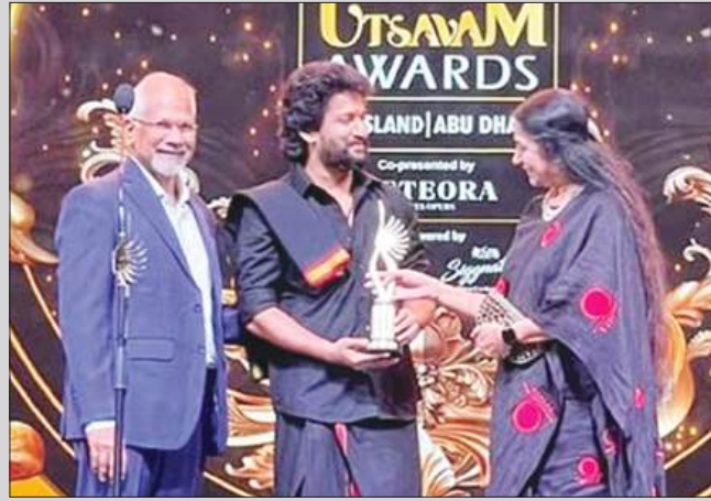
सम्मानित किया गया।

इस अवॉर्ड नाइट में बहुत से चर्चित सितारे शामिल हुए थे। अवॉर्ड नाइट में मणिरत्नम, सामंथा रुथ प्रभु,