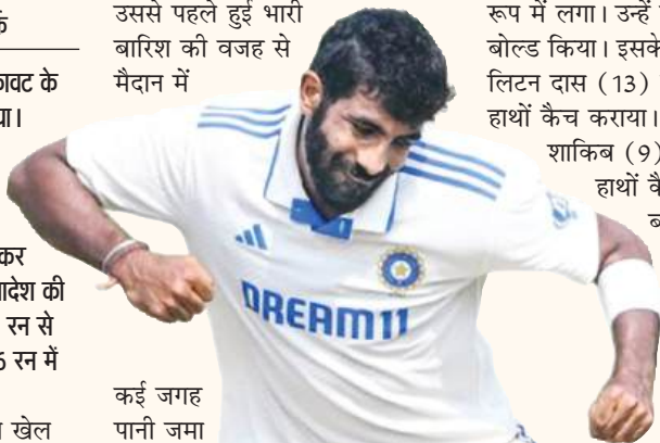
कई जगह पानी जमा

कानपुर। आखिर दो दिनों की रुकावट के बाद कानपुर टेस्ट मैच शुरू हो गया। सोमवार यानी 30 सितंबर को टेस्ट के चौथे दिन का खेल जारी है। बांग्लादेश ने अपनी पहली पारी में 233 रन बनाए। टॉस हारकर पहले बल्लेबाजी करने उतरी बांग्लादेश की टीम ने आज तीन विकेट पर 107 रन से आगे खेलना शुरू किया और 126 रन में अपने सात विकेट गंवा दिए। पहले दिन 35 ओवर का खेल