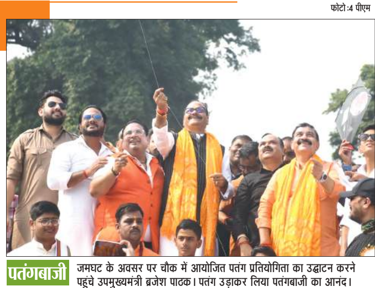
फोटो: 4 पीएम

मरीज और उनके परिवार पहले से ही जरूरी उपचार में वित्तीय चुनौतियों का सामना कर रहे हैं। दवाओं की कीमतों में वृद्धि से इन व्यक्तियों पर अतिरिक्त बोझ पड़ सकता है, जिससे उनके स्वास्थ्य परिणाम प्रभावित हो सकते हैं।