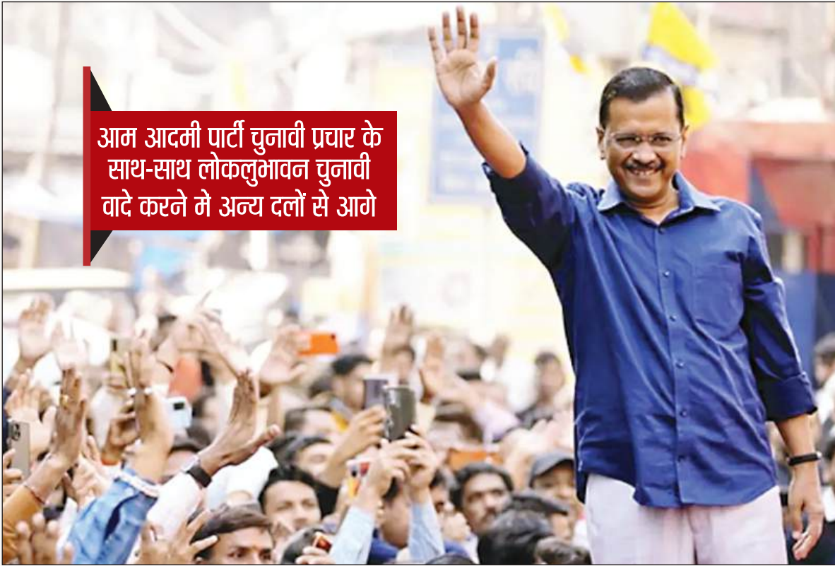
आम आदमी पार्टी चुनावी प्रचार के साथ-साथ लोकलुभावन चुनावी वादे करने में अन्य दलों से आगे

हालांकि सियासी जानकारों का कहना है कि कांग्रेस को बाहर करने की आप की मांग निराधार है। उधर वह अपने सबसे बड़े सियासी प्रतिद्वंद्वी भाजपा पर हमले का कोई भी मौका नहीं छोड़ रहे हैं। जहां एलजी द्वारा महिलाओं के लिए शुरू की योजना पर टिप्पणी को लेकर आप ने भाजपा पर वार करते हुए यह कहना शुरू कर दिया है कि मोदी सरकार दिल्ली में विकास नहीं चाहती है और आप की योजनाओं से डर गई है। दिल्ली में लगातार विधानसभा का चुनाव जीत रही आम आदमी पार्टी ने अब विपक्षी इंडिया गठबंधन से कांग्रेस को ही बाहर निकालने की मांग कर दी है। हालांकि केजरीवाल की पार्टी की इस बेतुकी मांग पर अभी इंडिया गठबंधन में शामिल अन्य विपक्षी दलों की कोई प्रतिक्रिया नहीं आई है लेकिन वास्तविकता तो सभी नेता जानते हैं। यहां तक कि विपक्षी गठबंधन से कांग्रेस को बाहर निकालने की मांग करने वाली आम आदमी पार्टी के नेता भी इस बात को बखूबी जानते हैं कि कांग्रेस को विपक्षी गठबंधन से बाहर भगाना संभव नहीं है। विडंबना देखिए कि, जिस विपक्षी इंडिया गठबंधन का गठन ही केंद्र से नरेंद्र मोदी सरकार को हटाने के लिए किया गया है। उस गठबंधन में लोकसभा में 3 सीट की हैसियत रखने वाली आम आदमी पार्टी 99 लोकसभा सांसदों वाली कांग्रेस पार्टी को गठबंधन से बाहर निकालने की बेतुकी मांग कर रही है।