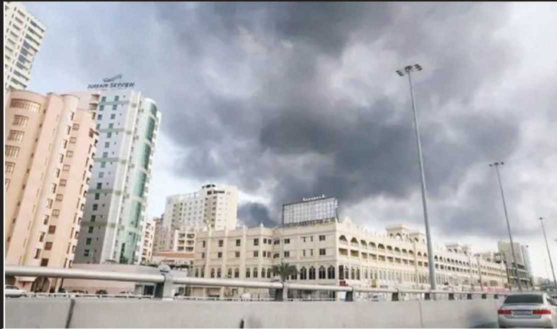
ईरान ने बहरीन में अमेरिकी नौसेना के पांचवें बेड़े के हेडक्वार्टर को निशाना बनाकर मिसाइल हमला किया

से ईरान के साथ संभावित बातचीत पर कोई असर नहीं पड़ेगा। उन्होंने कहा, नहीं, बिल्कुल नहीं, यह युद्ध है, हम युद्ध में हैं। उनके इस बयान से साफ संकेत मिलता है कि अमेरिका इस स्थिति को बेहद गंभीरता से देख रहा है और पीछे हटने के मूड में नहीं है।