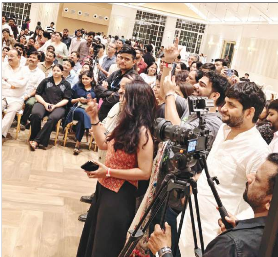
बन जाती है। स्वानंद किरकिरे की आवाज ने महफिल को रूह दी तो मौसम ने उसे और रंगीन और हसीन बना दिया।