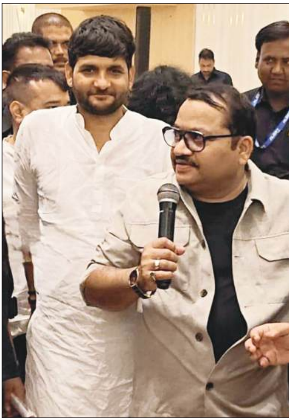
किया। उसने यह साबित कर दिया कि जब संगीत दिल को छूता है तो कोई भी मुश्किल, मुश्किल न रहकर हमसफर

वर्षा के बीच अलग ही नजारा देखने को मिल रहा था। भीगी कुर्सियां हल्की ठंडी हवा और उन सबके बीच बैठे लोग कोई छाता थामे, कोई बूंदों को अपने चेहरे पर गिरने देता हुआ हर कोई इस नजारे को अपने तरीके से जी रहा था। कोई भी उठकर जाने को तैयार नहीं था क्योंकि उस रात का हर पल जैसे एक नई इबारत लिख रहा था। ऐसा लग रहा था जैसे नेचर खुद इस महफिल की मेजबान बन गई हो। बारिश ने सिर्फ जमीन को नहीं भिगोया उसने दिलों को भी सराबोर