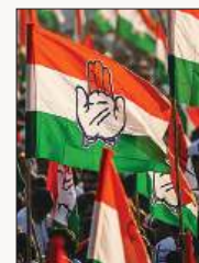
होगा। कुछ हजार वोटों से जीत-हार तय होने वाली सीटों पर ये छोटे फैक्टर बड़ा असर दिखा सकते हैं।

कांग्रेस भी कुछ गैर-बीजेपी वोटों में सेंधमारी कर सकती है। इससे TMC की मुश्किलें बढ़ेंगी। हुमायूं कबीर की आम जनता उन्नयन पार्टी और एसयूटीडीन ओवैसी की एआईएमआईएम ने पहले गठबंधन किया था, लेकिन कबीर के एक कथित रिटर्न के बाद एआईएमआईएम ने गठबंधन तोड़ दिया। इसका टीएमसी पर कितना असर होता है, यह भी देखना