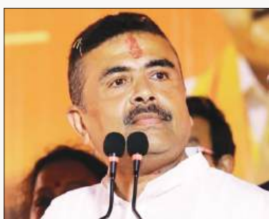
जिसे तृणमूल कांग्रेस पार्टी

कार्यकर्ताओं को सुनियोजित तरीके से नकली प्रेस पहचान पत्र जारी कर रहा है। उन्होंने दावा किया कि जो लोग पत्रकार नहीं हैं, उन्हें मीडिया सदस्य के रूप में पेश किया जा रहा है, ताकि वे मतदान केंद्रों और प्रमुख