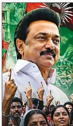
उन्हें तब 54.68 प्रतिशत वोट मिले थे। चेन्नई में भारी मतदान ने ही डीएमके को

तमिलनाडु की जीत में चेन्नई की भूमिका काफी अहम मानी जाती है। वोटिंग से पहले एम के स्टालिन ने दावा किया है कि चेन्नई में डीएमके का झंडा लहराएगा। दरअसल, 234 सीटों वाले तमिलनाडु में सत्ता की चाबी अक्सर चेन्नई की उन 16 सीटों के पास रहती है, जिन्हें तमिलनाडु की राजनीति का सबसे भरोसेमंद बैरोमीटर कहा जाता है। जिसने चेन्नई जीता वही तमिलनाडु का सिकंदर बना है। पिछले चुनाव में चेन्नई की 16 सीटें डीएमके गठबंधन के खाते में गईं। यहां