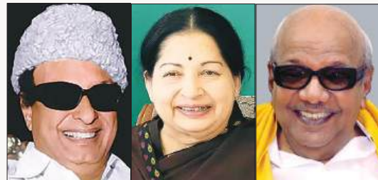
मकल नीधि मय्यम पार्टी 21 छोड़ पाई और वे खुद भी चुनाव के चुनाव में खास असर नहीं हार गए थे। दरअसल,

तमिलनाडु की राजनीति में फिल्मी सितारों का प्रभाव नया नहीं है। एम.जी. रामचंद्रन (एमजीआर), जे. जयललिता और एम. करुणानिधि जैसे दिग्गजों ने सिनेमा से राजनीति में सफल बदलाव का उदाहरण पेश किया। लेकिन हर अभिनेता को यह सफलता नहीं मिली। कमल हासन की