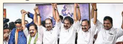
मुताबिक यूडीएफ करीब 90 सीटों पर आगे चल रहा है, जबकि वाम मोर्चा 35 और भाजपा 3 सीटों पर बढ़त बनाए हुए है। कांग्रेस

केरल विधानसभा चुनावों की मतगणना के अंतिम चरण में कांग्रेस नेतृत्व वाले यूनाइटेड डेमोक्रेटिक फ्रंट (यूडीएफ) की जोरदार बढ़त के साथ राज्य की राजधानी तिरुवनंतपुरम स्थित कांग्रेस मुख्यालय में जश्न का माहौल बन गया है। रुझानों के