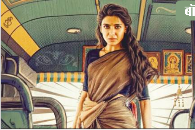
सामंथा और नंदिनी रेड्डी की ओह बेबी के बाद दूसरी फिल्म है। यह एक