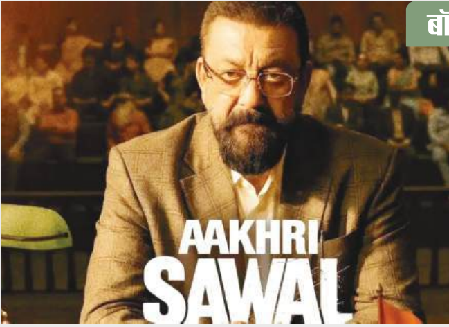
आखिरी सवाल का बजट लगभग 40 करोड़ रुपये के आस पास है। इस लिहाज से फिल्म की अब तक की कमाई काफी धीमी रही है। इस