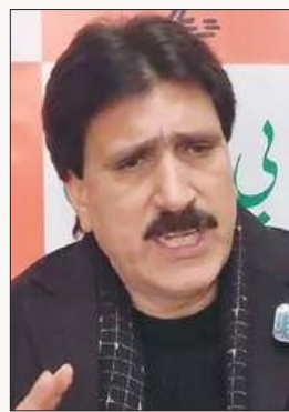
टाकुर ने इस मामले को घाटी की नैतिक अखंडता की लड़ाई

जम्मू और कश्मीर में उस समय राजनीतिक माहौल और भी गरमा गया, जब भारतीय जनता पार्टी (भाजपा) ने नेशनल कॉन्फ्रेंस के नेतृत्व वाली सरकार की आलोचना करते हुए चेतावनी दी कि अगर सरकार नैतिकता पर राजस्व को प्राथमिकता देना जारी रखती है तो वह शराब की दुकानों को शारीरिक रूप से बंद कर देगी। श्रीनगर में पत्रकारों को संबोधित करते हुए जम्मू-कश्मीर भाजपा प्रवक्ता अल्ताफ