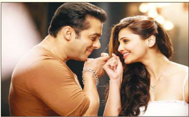
पांच से सात मिनट बहुत लंबा समय होता है। उस समय तो यह बहुत लंबा लगा ही था। ऐसी स्थिति में तो अब भी बहुत लंबा लगाता है। मैं अंदर ही अंदर बोल रही थी 'कुछ बोलिए, कुछ बोलिए।' और उनके मुंह से बस एक ही शब्द निकला। उन्होंने कहा,

बॉलीवुड बबल से बात करते हुए डेजी शाह ने बताया कि 'जय हो' में सलमान खान के साथ काम करने से पहले, उन्होंने सलमान की फिल्म 'बाडीगार्ड' का ऑफर टुकड़ा दिया था। अब उन्होंने 'बाडीगार्ड' के ऑफर को टुकड़ाने के बाद सलमान की प्रतिक्रिया के बारे में बताया। उन्होंने कहा कि मेरे ऐसा करने के बाद कमरे में करीब पांच से सात मिनट तक सन्नता छाया रहा।