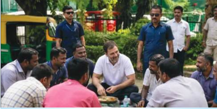
चालक के साथ किया दोपहर का भोजन

राहुल गांधी ने बंगाली मार्केट के पास टोडरमल रोड पर लगभग आधा घंटा बिताया, जहां उन्होंने टोडरमल पार्क में जमा हुए चालकों से बातचीत की। इस दौरान, उन्होंने