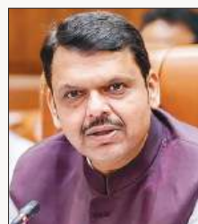
है? मुझे महाराष्ट्र के 14 करोड़ लोगों और अपने

पालघर में इंफ्रास्ट्रक्चर प्रोजेक्ट्स का जायजा लेने के बाद पत्रकारों से बात करते हुए फडणवीस ने इस दावे को खारिज कर दिया और कहा कि उनका पूरा ध्यान विकास पर है। मुख्यमंत्री ने कहा, मैं एक इंसान हूँ। मेरे पंख नहीं हैं, तो उन्हें कौन काट सकता