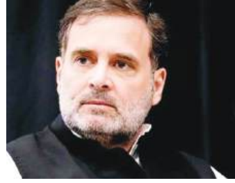
पार्टी और कांग्रेस दोनों को एक राजनीतिक संकेत देने की कोशिश की है।

राहुल गांधी ने सोशल मीडिया प्लेटफॉर्म एक्स पर अखिलेश यादव को जन्मदिन की शुभकामनाएं दीं। उन्होंने अपने संदेश में लिखा, अखिलेश जी को जन्मदिन की बहुत-बहुत बधाई। पीडीए की हिस्सेदारी से सामाजिक न्याय का संकल्प हम मिलकर पूरा करेंगे। अच्छे स्वास्थ्य और खुशहाल जीवन के लिए शुभकामनाएं। राहुल गांधी के इस संदेश को राजनीतिक नजरिए से भी अहम माना जा रहा है। उन्होंने अपने संदेश में पीडीए का जिक्र कर समाजवादी