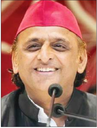
रामगोपाल यादव ने अपने आवास के पास पार्टी नेताओं, विधायकों और कार्यकर्ताओं के साथ 53 अमलतास के पौधे लगाकर जन्मदिन मनाया।

समाजवादी पार्टी के राष्ट्रीय अध्यक्ष के 53वें जन्मदिन के अवसर पर सैफई में पार्टी के राष्ट्रीय महासचिव प्रोफेसर